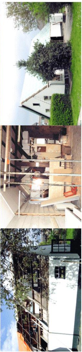
2004 Renovatie van de boerderij