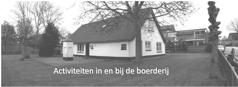
Activiteiten in en bij de boerderij